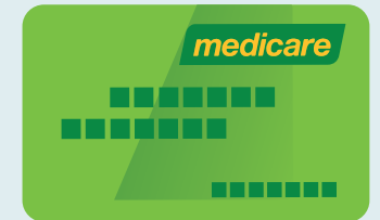
Tarjeta de Medicare

Para más información sobre cómo solicitar cobertura de Medicare, comuníquese con el Services Australia Medicare Program llamando al 132 011 .