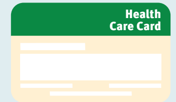
Tarjetas de Salud

La Tarjetas de Salud esta destinada a las personas con ingresos más bajos y puede ayudarlo a acceder a algunos servicios de salud y obtener algunos medicamentos de venta con receta a un precio más barato. Por lo general, esta tarjeta no ayuda a sufragar los costos de vitaminas y suplementos. Consulte con Centrelink para saber si usted tiene derecho a esta tarjeta.