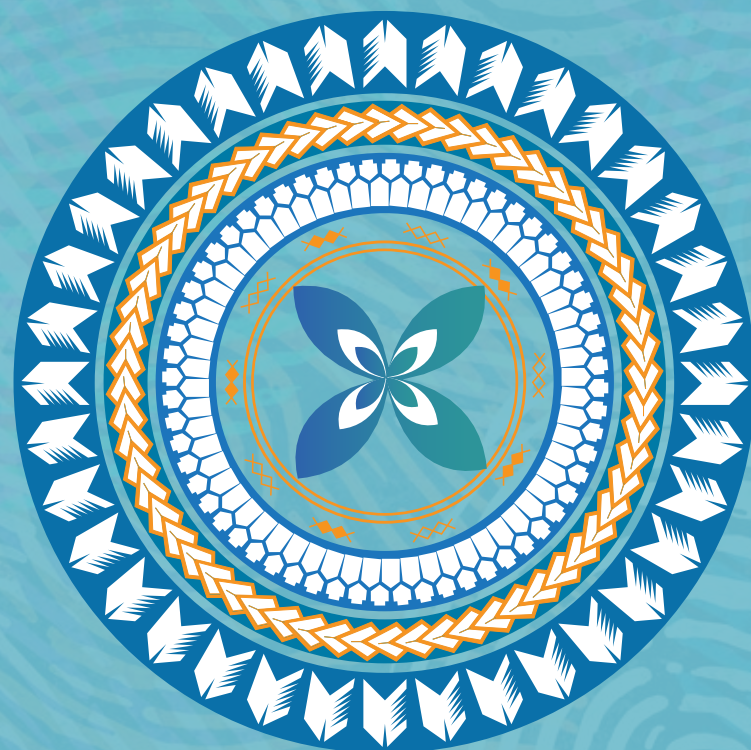
Obra de Emele Tuinona.

Este recurso fue elaborado por Mater Refugee Health con revisiones de comunidades multiculturales y profesionales sanitarios a través de Refugee Health Network Queensland , en consulta con Queensland Health . Contiene solamente información sanitaria general. Consulte con su profesional de la salud si desea más orientación o consejos específicos.